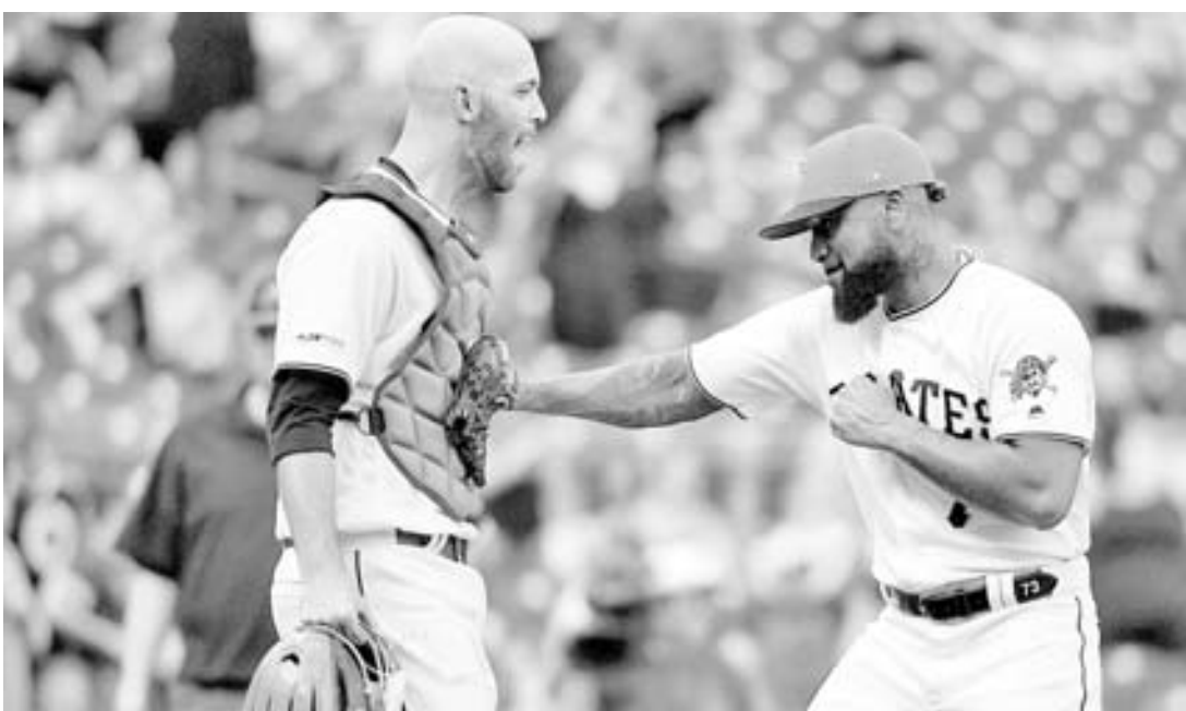
El lanzador yaracuyano realizó 23 lanzamientos de los cuales 18 fueron strikes en su presentación