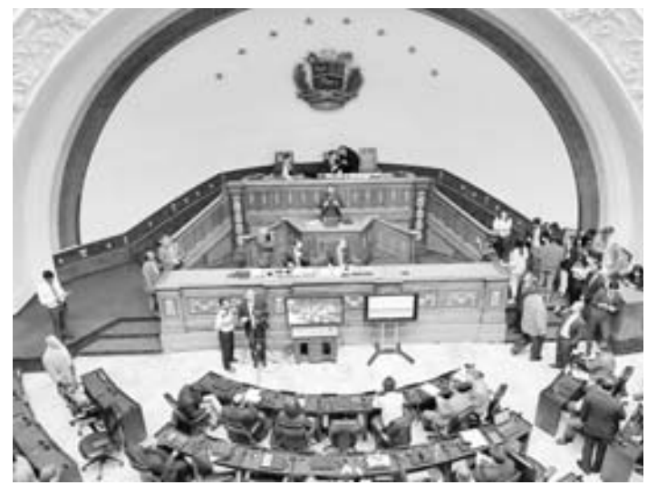
Esta semana la AN aprobará el reingreso al TIAR. LUIS MORILLO