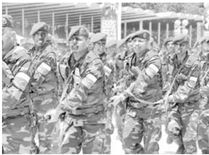
Las maniobras serán en honor al Libertador y la Armada.

"Por eso ratifico mi llamado al diálogo nacional, reitero mi orden para que la Fuerza Armada Nacional Bolivariana vaya a la vanguardia encabezando las luchas del pueblo, por las dignidad, la independencia, el