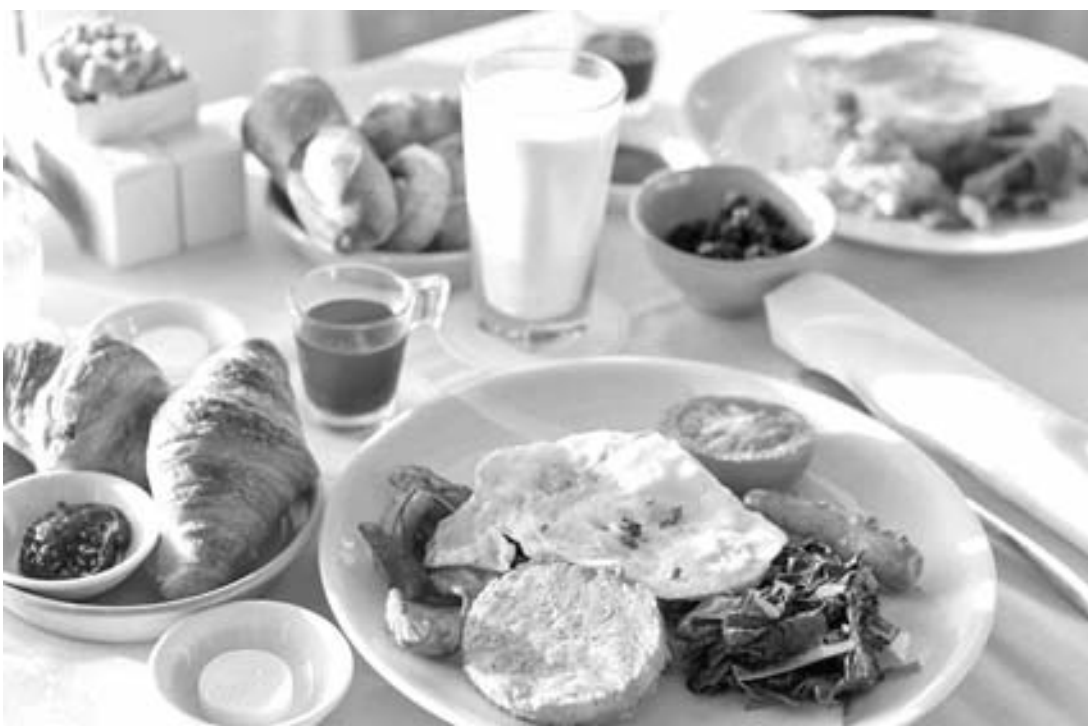
Un buen desayuno es necesario para poder adquirir los nutrientes necesarios para el día a día