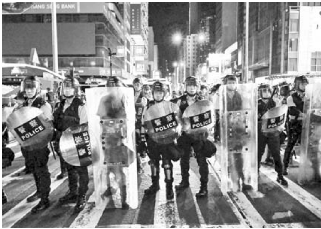
Policías de Hong Kong reprimieron las protestas nocturnas registradas frente a una estación de trenes