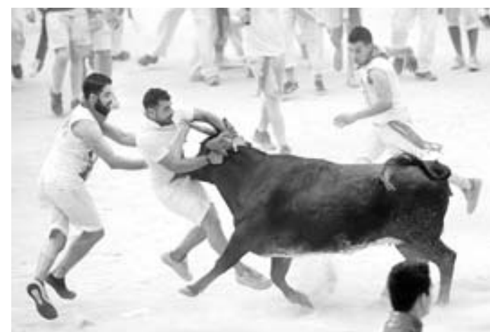
Toro cornea a uno de los participantes en el primer encierro

Ernest Hemingway inmortalizó el festival en su libro Fiesta , publicado en 1926.