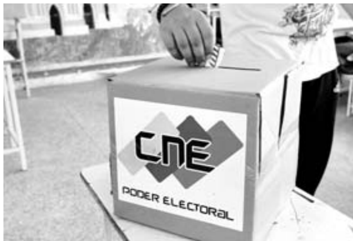
La encuesta de la UCAB da un 54,7% a Guaidó. ANDRÉS TORRES

que la diáspora vote a favor, el grupo opositor se mantendría en ventaja, pues obtendrían unos 9,9 millones de votos.