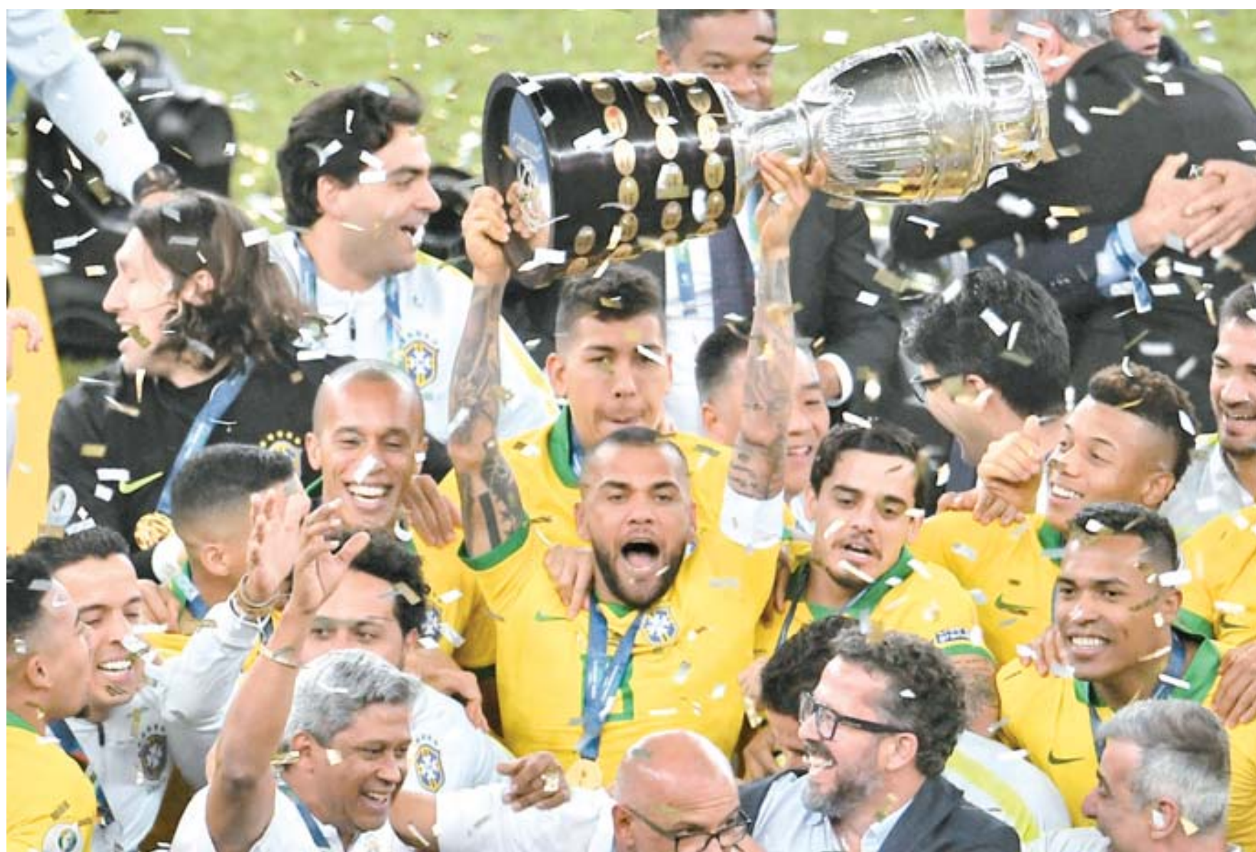
Los jugadores de la Canarinha dieron la vuelta triunfal en el mítico estadio de Maracanã, en Río de Janeiro, luego de vencer a los aguerridos incas en el cotejo final