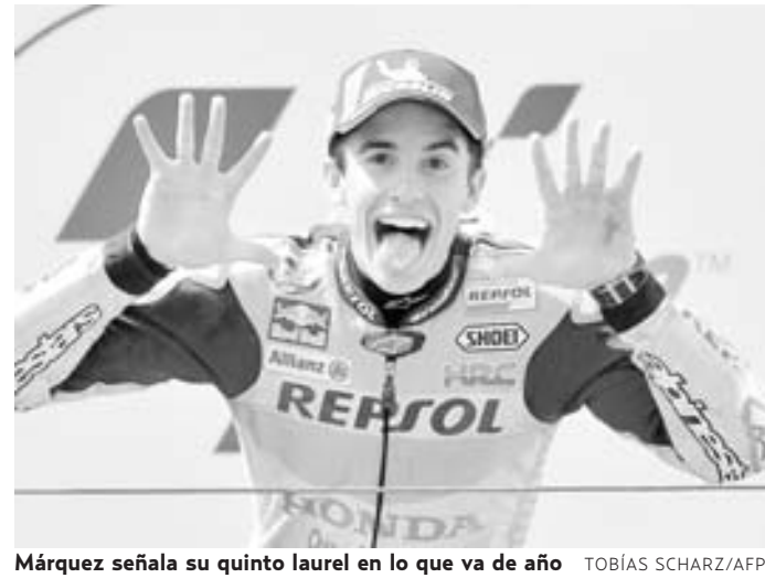
Márquez señala su quinto laurel en lo que va de año

Los pilotos Ducati pueden darse por satisfechos: mal clasificados, aprovecharon los abandonos y un buen ritmo de carrera para remontar y terminar a los pies del podio.