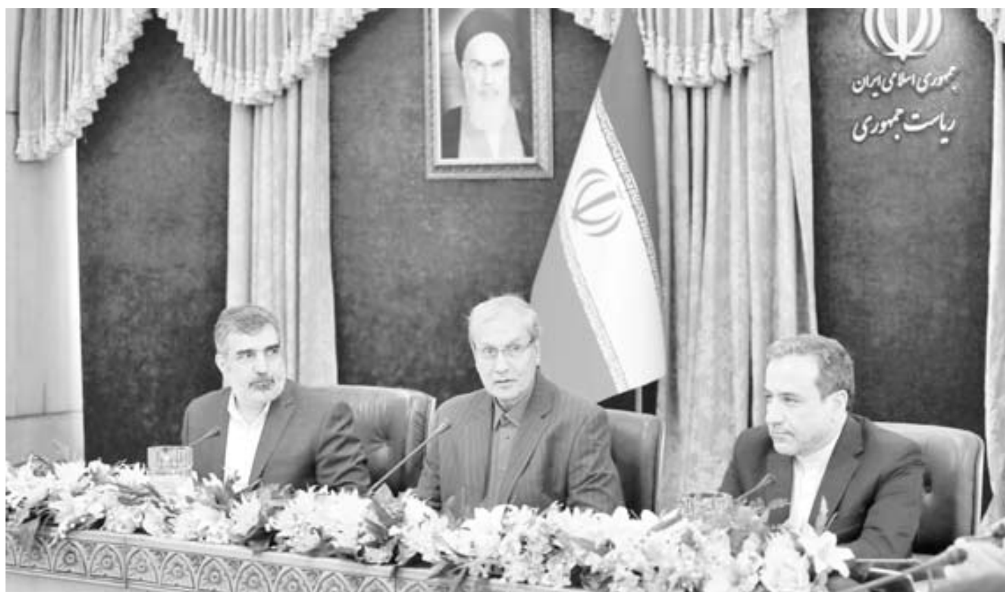
Behruz Kamalvandi, Ali Rabiei y Abbas Araghchi anuncian que Irán volverá a enriquecer uranio por encima del límite acordado en 2015