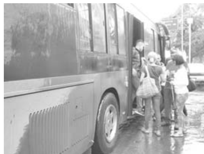
Pasajeros deben esperar hasta cinco horas por transporte.

Hizo un llamado al alcalde es para que revise la tarifa. "Pero mientras no lo haga los pasajeros seguirán pagando plantón de hasta cinco horas en el terminal", destacó.