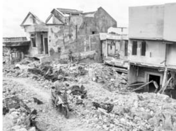
Palu quedó devastada hace nueve meses por un sismo de 7,5

Es hijo de un expresidente ministro, descendiente de una gran dinastía política, lo que significa un regreso a la “familiocracia” en el gobierno griego, una tradición que Tsipras interrumpió.