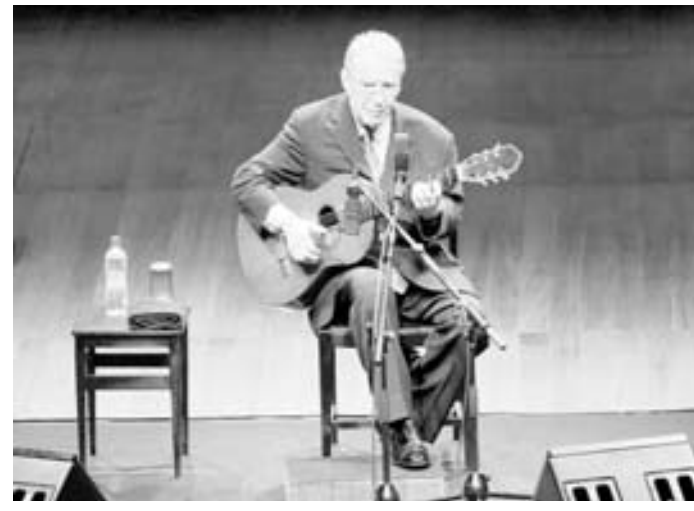
Joao Gilberto fue considerado un obsesivo perfeccionista

"Los quiero y que Dios los bendiga", concluyó el cantante nacido en Michigan en 1950. Se dice que aprendió a tocar el piano, la batería y la armónica a los nueve años y publicó su primer álbum en 1961, para el sello discográfico Motown de Detroit.