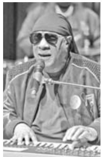
"Todo va bien, tengo un donante", dijo en Londres

"En su obsesión por el control, tenía la ambición de pagar el mundo para ejercer su arte. Delante del micrófono, lo consiguió. Fuera del escenario, fue lo contrario: nunca tuvo control sobre su vida", escribió Ruy Castro, autor del libro sobre la bossa nova Chega de Saudade .