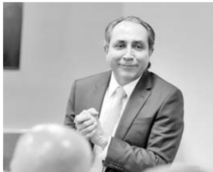
89% de las Casas de Bolsa están afiliadas a la ANOV V. ALCAZARES

Obtiene el título de economista de la Universidad de Houston (1978), con maestría en Finanzas y candidato a doctorado. Ha realizado estudios de economía también en México, Reino Unido y Suecia. Abogado de la Universidad Santa María (1987).