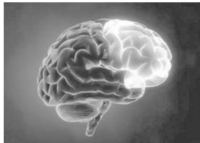
El sistema podría ayudar en el desarrollo de ensayos clínicos

El objetivo del equipo de especialistas del Hospital Houston Methodist es que, dentro de cinco años, se utilice este sistema para desarrollar ensayos clínicos.