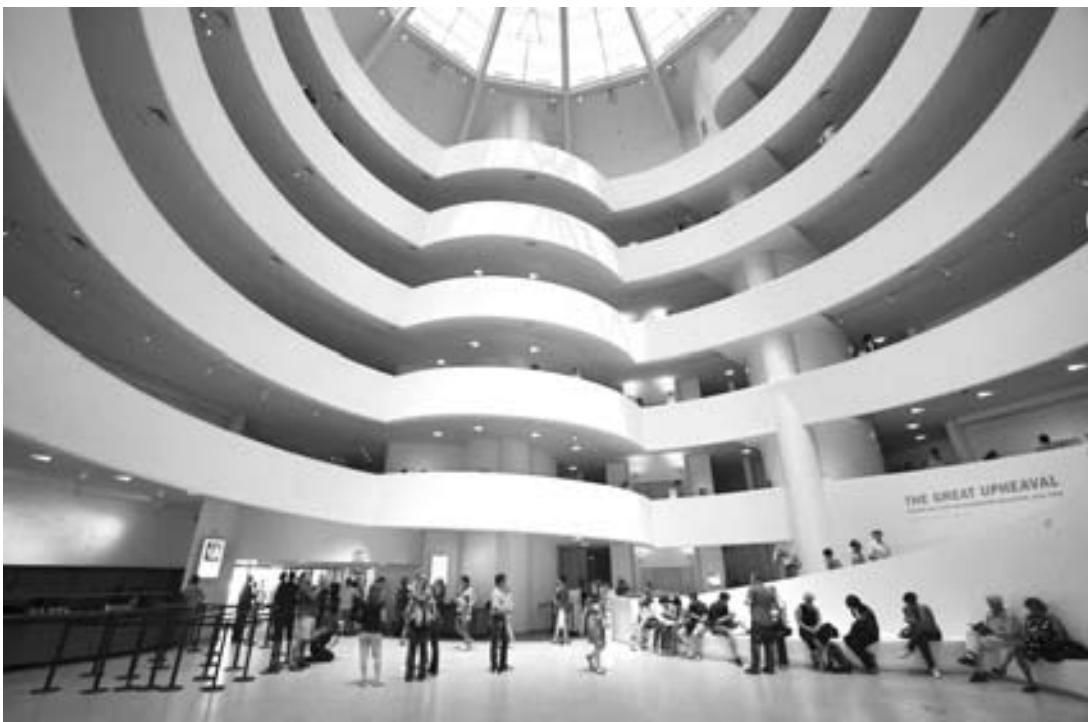
La espiral del Museo Salomón R. Guggenheim acoge una importante colección de arte de distintas épocas